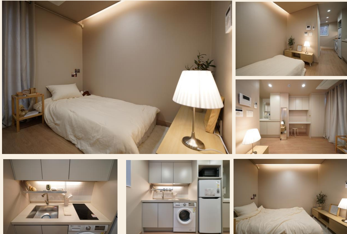
위 사진들은 촬영용 연출된 사진입니다