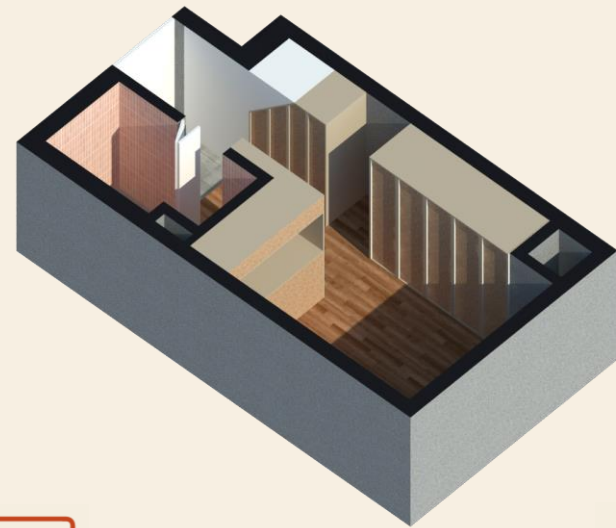
풀옵션의 1인 주거 공간