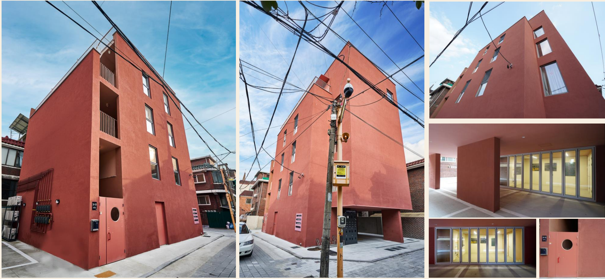
레트로한 벽돌색 건물의 깔끔하고 쾌적한 신축 건물